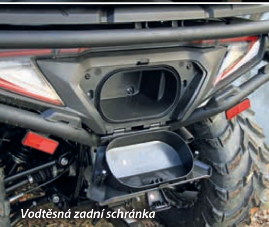
Vodtěsná zadní schránka