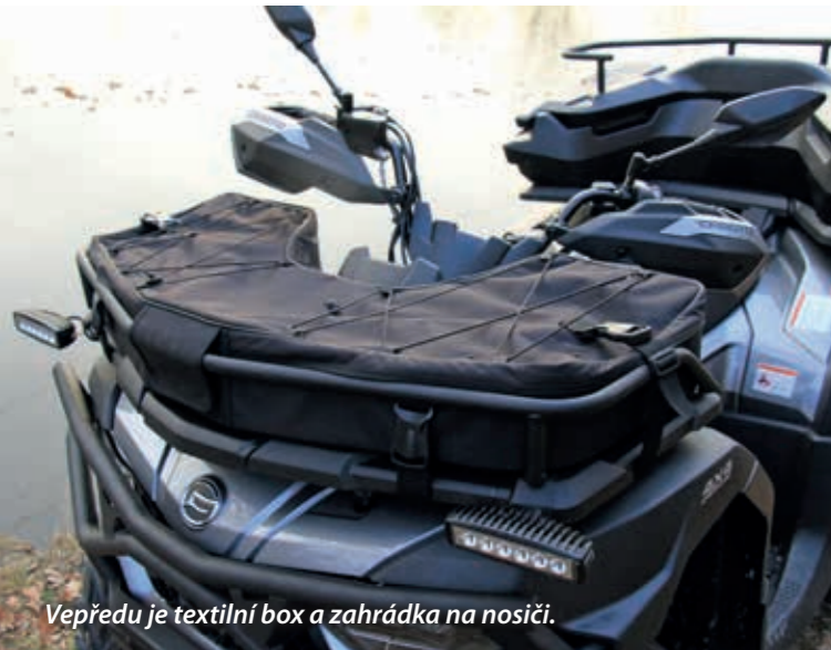
Vepředu je textilní box a zahrádka na nosiči.