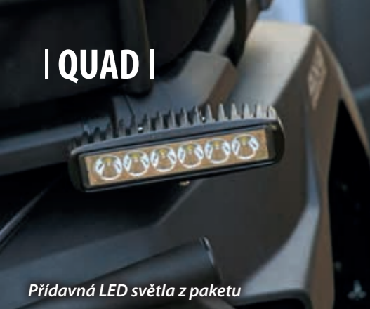
Přídavná LED světla z paketu