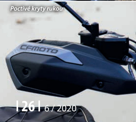
Poctivé kryty rukou

“ Zajímavé je, že na hmotnosti to dá celkem 20 kg, což už je dost znát. ”