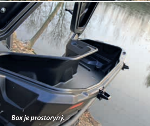
Box je prostorný.