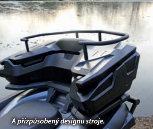
A přizpůsobený designu stroje.